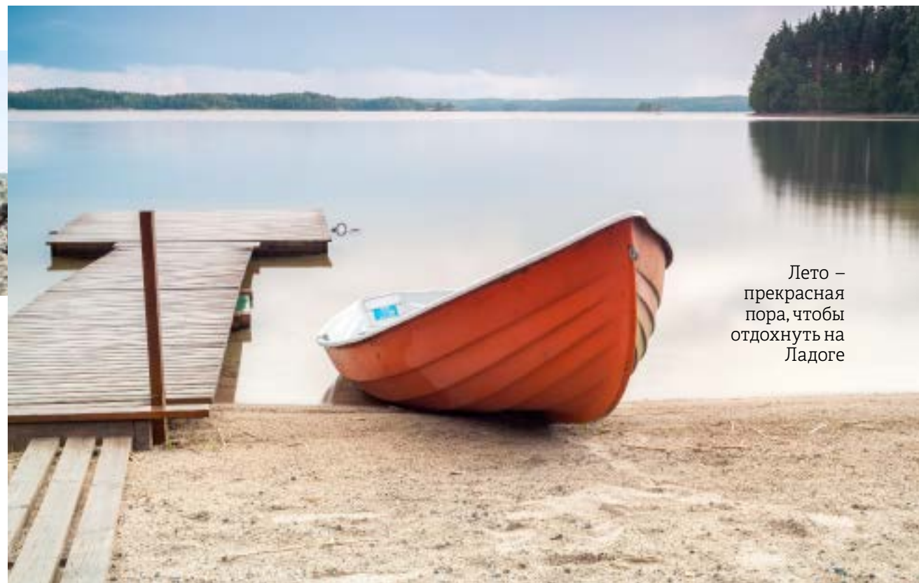
Лето – прекрасная пора, чтобы отдохнуть на Ладоге

📍 По автодороге А-121 "Сортавала", 183 км от города.