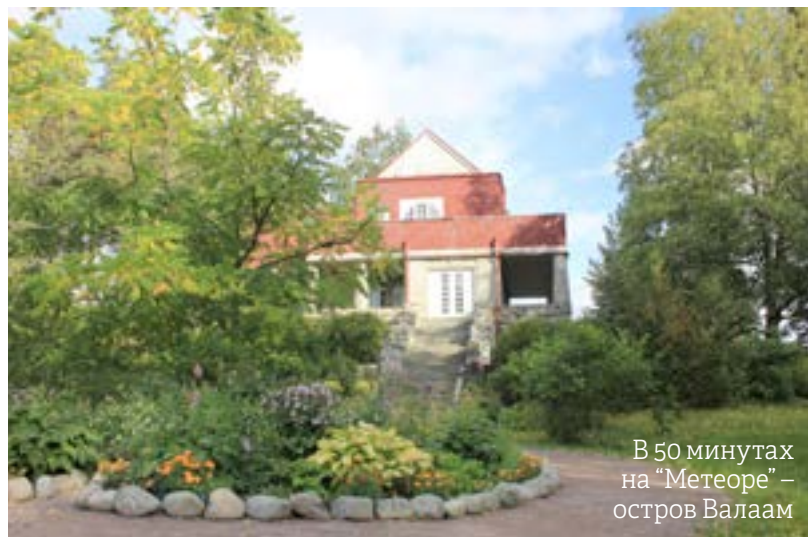
В 50 минутах на "Метеоре" – остров Валаам

творчеству художника-философа Николая Рериха, часто бывавшего у Винтера и написавшего тут около 200 картин. Здесь сбываются мечты о безупречных каникулах: можно посидеть на берегу Ладоги с удочкой, собрать полные корзины грибов, послушать народные песни, попробовать местную кухню.